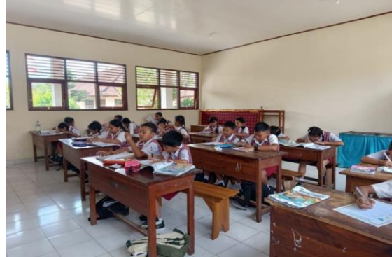
Gambar 5. Siswa Mengerjakan Soal Esai

I Kadek Wellaga, Wawancara tanggal 15 April 2026: "Setelah video pembelajaran selesai diputar dan materi dijelaskan kembali, saya memberikan soal esai kepada siswa untuk mengetahui pemahaman siswa terhadap materi yang telah dipelajari."