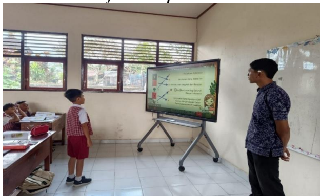
Gambar 7. Salah Satu Siswa Maju ke Depan Kelas untuk Menjawab Pertanyaan