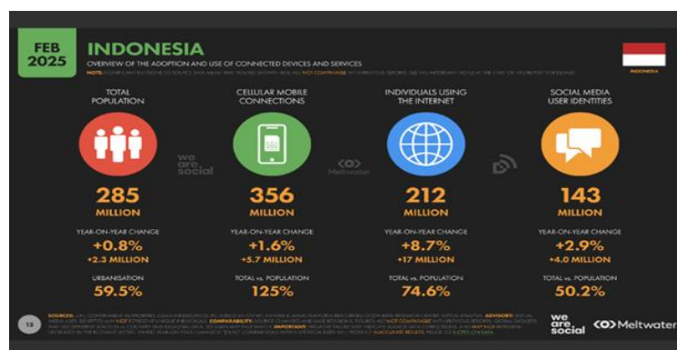
Gambar 1. Pengguna Internet dan Media Sosial Indonesia Tahun 2025

Di Indonesia sendiri, perkembangan dunia digital menunjukkan pertumbuhan yang pesat. Berdasarkan DataReportal (2025) terdapat laporan Digital 2025 Indonesia oleh We Are Social dan Meltwater , jumlah pengguna internet mencapai 212 juta orang, atau sekitar 74,6% dari total populasi yang berjumlah 285 juta jiwa. Kemudian, terdapat 143 juta orang di Indonesia tercatat aktif menggunakan media sosial, yang berarti setengah dari total penduduk kini menjadikan platform digital sebagai bagian dari keseharian mereka.