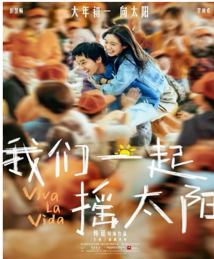
Gambar 1. Poster Film Viva La Vida

Viva La Vida merupakan film drama romantis Tiongkok yang dirilis pada 10 Februari 2024 dan disutradarai oleh Han Yan. Film ini diproduksi oleh China Film Co., Ltd. dan menempati posisi sebagai bagian penutup dalam trilogi film tentang kehidupan garapan sutradara Han Yan (Taicike, 2024). Pemeran utama terdiri atas Peng Yuchang sebagai Luu Tu dan Li Gengxi sebagai Ling Min. Kedua tokoh tersebut digambarkan sebagai anak muda dengan kondisi medis berat yang membentuk inti cerita. Film ini dikategorikan sebagai drama keluarga dan romantis dengan orientasi pada isu kesehatan serta ketahanan emosi.