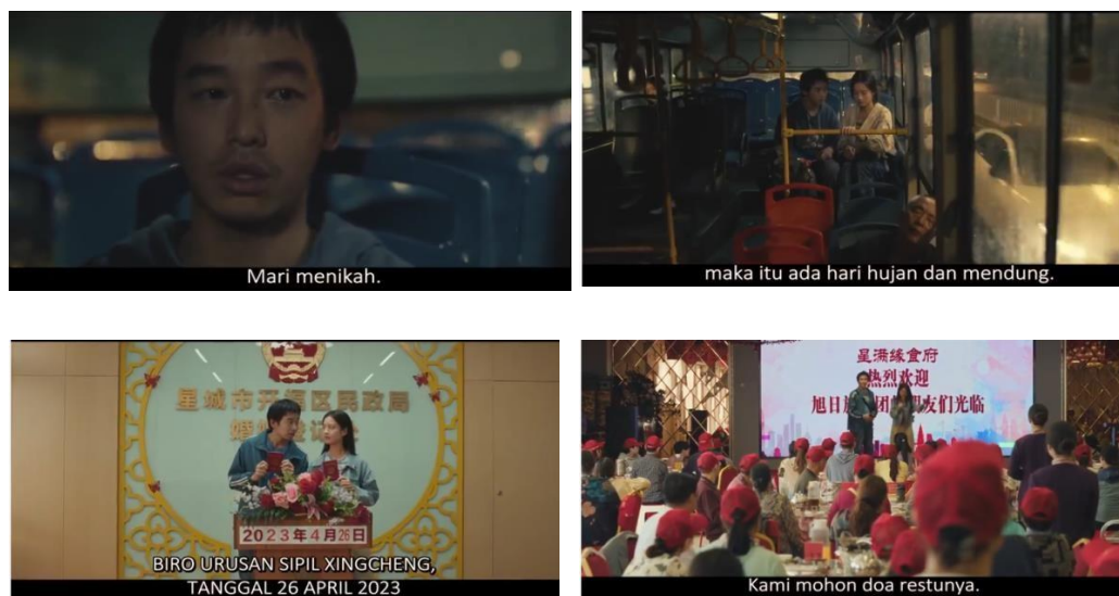
Gambar 5. Adegan Keputusan Menikah dan Perayaan Pernikahan

Hubungan antara ruang bus malam yang sempit dan personal, percakapan yang berlangsung dalam jarak dekat, serta keputusan mendaftarkan pernikahan secara resmi menghasilkan pemaknaan perubahan bentuk hubungan dari pertentangan menjadi kesepakatan bersama. Keputusan tersebut menunjukkan bahwa ancaman biologis yang sebelumnya menjadi sumber konflik kini dihadapi melalui pembentukan ikatan formal. Perpindahan ke kantor urusan sipil dan kemunculan dokumen pernikahan menunjukkan perubahan status hubungan ke dalam kerangka hukum dan sosial. Perayaan di ruang publik bersama rombongan wisatawan memperluas keputusan privat tersebut ke hadapan komunitas yang lebih luas meskipun tanpa keterlibatan keluarga. Rangkaian makna tersebut menunjukkan pergeseran posisi Ling Min dari individu yang berhadapan sendiri dengan kondisi medis menuju bagian dari pasangan yang mengambil keputusan bersama dalam menghadapi situasi hidupnya