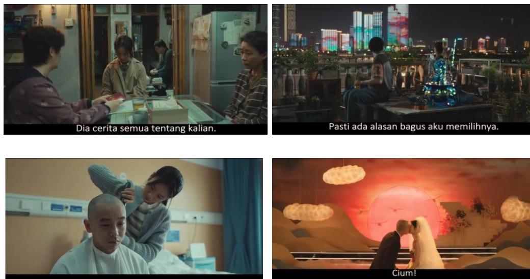
Gambar 7. Adegan Persetujuan Operasi dan Penegasan Makna Hidup