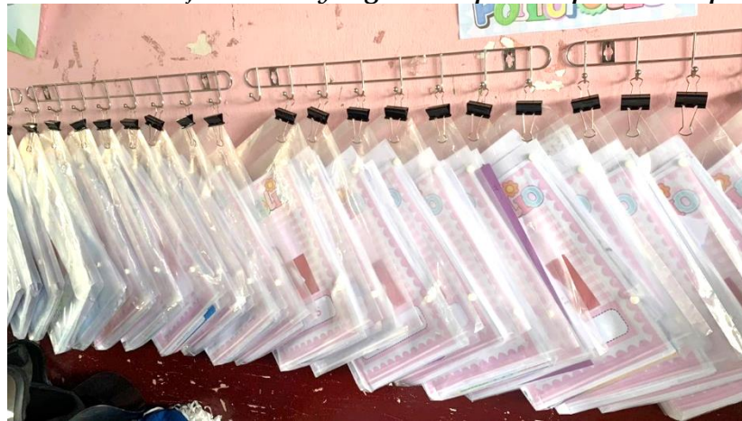
Gambar 3. Hasil Belajar Siswa yang Dikumpulkan pada Tahap Evaluasi