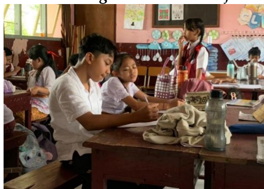
Gambar 1. Proses Tutoring dalam Pembelajaran Matematika

“Pada awal pembelajaran guru biasanya hanya memberikan gambaran umum tentang KPK dan FPB, seperti pengertiannya, perbedaannya, dan contoh sederhana. Tujuannya supaya semua siswa punya pemahaman awal yang sama sebelum mereka belajar dalam kelompok, pemberian beberapa pertanyaan sederhana di awal juga dilakukan untuk melihat sejauh mana pemahaman mereka. Ini penting supaya guru bisa mengetahui kesiapan siswa sebelum masuk ke diskusi kelompok”