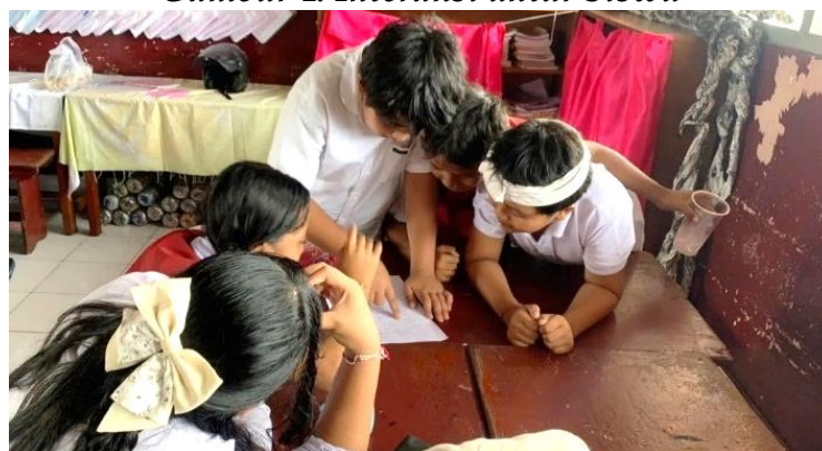
Gambar 4. Interaksi antar Siswa

Keaktifan belajar siswa mengalami peningkatan yang cukup signifikan pada kegiatan interaksi antar siswa dan interaksi dengan guru. Melalui strategi peer tutoring pada pembelajaran matematika materi KPK dan FPB, aktivitas belajar yang sebelumnya terbatas pada mendengarkan penjelasan guru berubah menjadi kegiatan yang melibatkan diskusi, tanya jawab, serta kerja sama dalam kelompok. Berdasarkan observasi yang dilakukan pada tanggal 8 September 2025 terkait implementasi strategi peer tutoring dalam pembelajaran matematika kelas V di SD Negeri 11 Sumerta Denpasar, diperoleh temuan bahwa terjadi interaksi antar siswa lebih sering dalam kegiatan diskusi kelompok, keterlibatan ini menunjukkan adanya perubahan sikap siswa terhadap pembelajaran yang menjadi lebih aktif dan dorongan kerja sama yang baik pada kegiatan diskusi kelompok. Interaksi yang intens antar siswa juga meningkatkan kemampuan sosial serta kerja sama dalam kelompok. Keadaan ini menunjukkan bahwa peer tutoring tidak hanya berdampak pada aspek akademik, tetapi juga pada perkembangan sosial yang mengakibatkan keterlibatan aktif interaksi antar siswa.