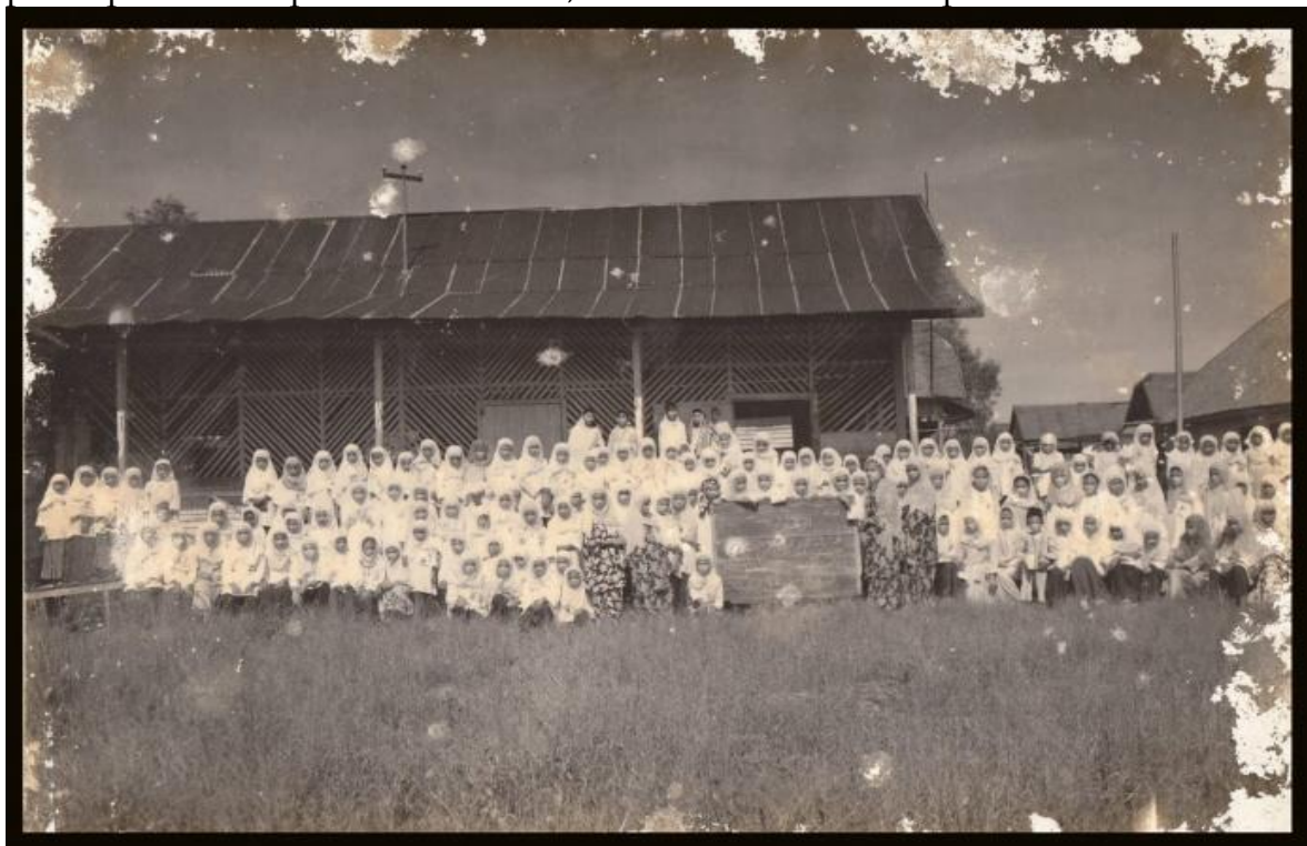
(Gambar 3. Pelajar ( Santriwati ) Perempuan Dengan Latar Gedung Yang Di Bangun Tahun 1936).

atas bahwa Madrasah Hidayatul Islamiyah sejak dari awal pendirian tahun 1936 dirancang dengan model pembelajaran modern, maka kemudian peserta didiknya pun tidak terbatas peserta didik laki-laki ( santriwan ) saja untuk belajar dan menempuh pendidikan. K. H. Muhammad Daud Arif pun, memberikan kesempatan yang sama kepada para peserta didik perempuan ( santriwati ) untuk belajar memperoleh ilmu pengetahuan, meski pun dalam praktek dan proses pembelajarannya diberi ruang pembatas tersendiri dengan peserta didik laki-laki ( santriwan ), dan dalam pengelolaan dan kelembagaan tetap dalam satu institusi/ lembaga pendidikan yang sama. Azra (2002: 94) mengemukakan, terdapat bukti yang tidak kuat bahwa perempuan hanya mendapat tempat yang terbatas dalam sistem pendidikan madrasah. Keterlibatan mereka dalam pendidikan madrasah jelas bukan secara co-ed- sistem campuran antara laki-laki dan perempuan. Dengan kata lain, dalam pendidikan madrasah, kelas-kelas yang ada di bagi-bagi menurut jenis kelamin; jadi ada kelas khusus laki-laki dan ada pula kelas khusus perempuan. Dan lagi pula, lazimnya kelas laki-laki dengan kelas perempuan ini terpisah secara ketat, meski dalam satu kompleks madrasah.