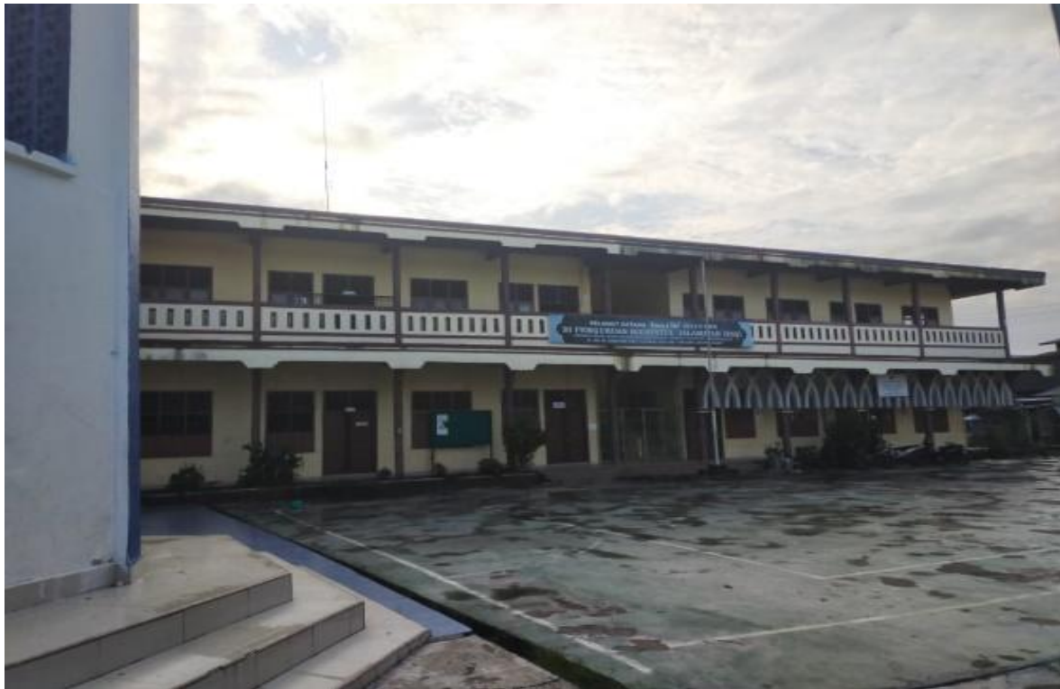
Gambar 3. Gedung Direnovasi Tahun 2017. Dokumentasi 2018

Berdirinya lembaga pendidikan Islam ini mendapat banyak dukungan terutama dari kalangan tokoh Agama dan tokoh masyarakat, diantaranya Haji Baharuddin yang merupakan penghulu dan sesepuh serta salah seorang diantara tokoh masyarakat yang awal-awal pembuka pemukiman di sekitar Kota Kuala Tungkal hari ini, bahkan tanah yang digunakan untuk pembangunan Madrasah Hidayatul Islamiyah tahun 1936 merupakan hibah/wakaf dari Haji Baharuddin.