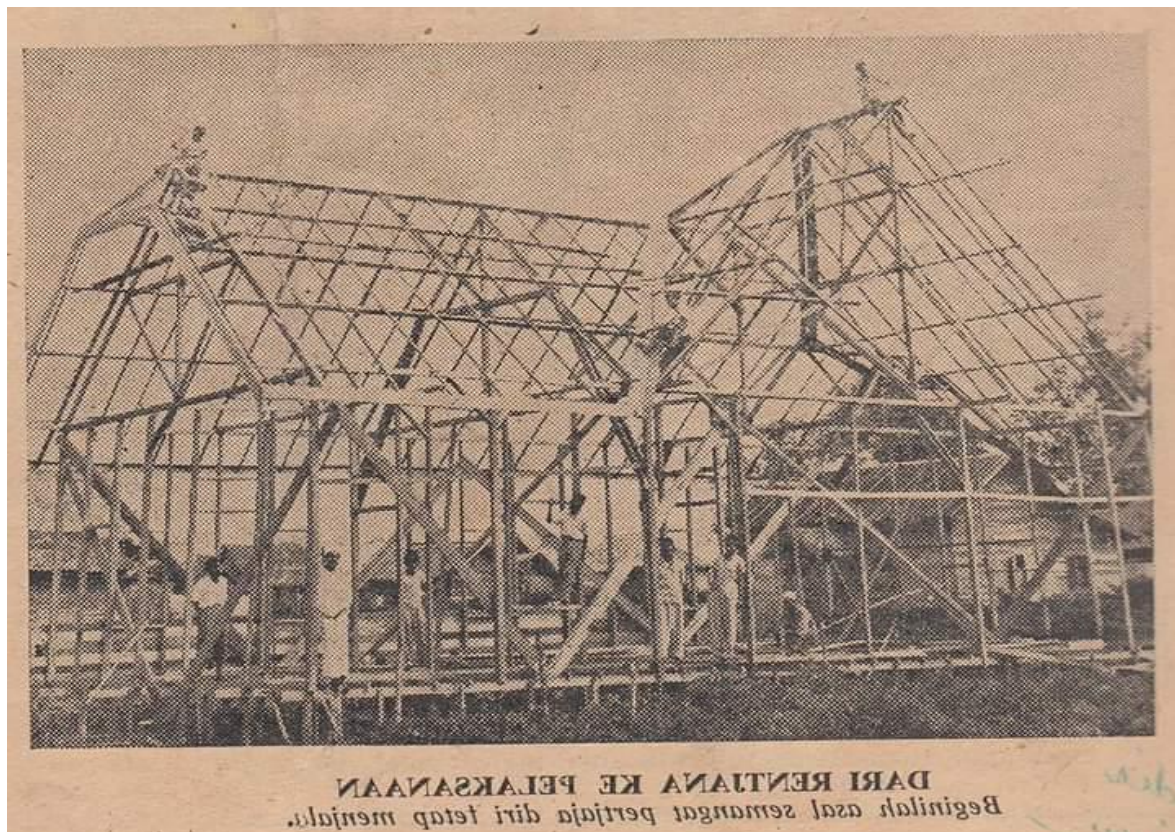
(Gambar 2: Gedung Renovasi Awal Tahun 1952)