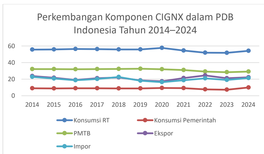
Gambar 3. Multi Line Perkembangan Komponen CIGNX dalam PDB Indonesia Tahun 2014–2024

Data komponen PDB dalam penelitian ini diperoleh dari publikasi Badan Pusat Statistik (BPS), yaitu Produk Domestik Bruto Indonesia Menurut Pengeluaran 2010–2014, Produk Domestik Bruto Indonesia Menurut Pengeluaran 2015–2019, dan Produk Domestik Bruto Indonesia Menurut Pengeluaran 2020–2024. Data yang digunakan meliputi komponen konsumsi rumah tangga, konsumsi pemerintah, Pembentukan Modal Tetap Bruto (PMTB), ekspor, dan impor (Badan Pusat Statistik, 2025).