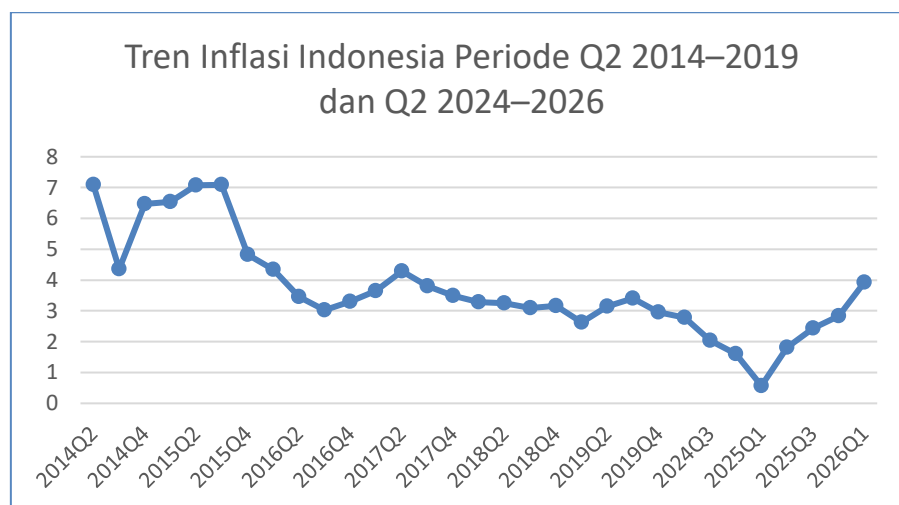
Gambar 2. Tren Inflasi Indonesia Periode Q2 2014–2019 dan Q2 2024–2026

Berdasarkan grafik tren inflasi Indonesia periode Q2 2014–2019 dan Q2 2024–2026, tingkat inflasi Indonesia menunjukkan kecenderungan menurun dan relatif stabil dalam jangka panjang. Pada awal periode penelitian, inflasi masih berada pada level yang cukup tinggi, yaitu di atas 6 persen pada tahun 2014–2015. Kondisi tersebut dipengaruhi oleh penyesuaian harga bahan bakar minyak dan tekanan harga komoditas pada periode awal pemerintahan Joko Widodo.