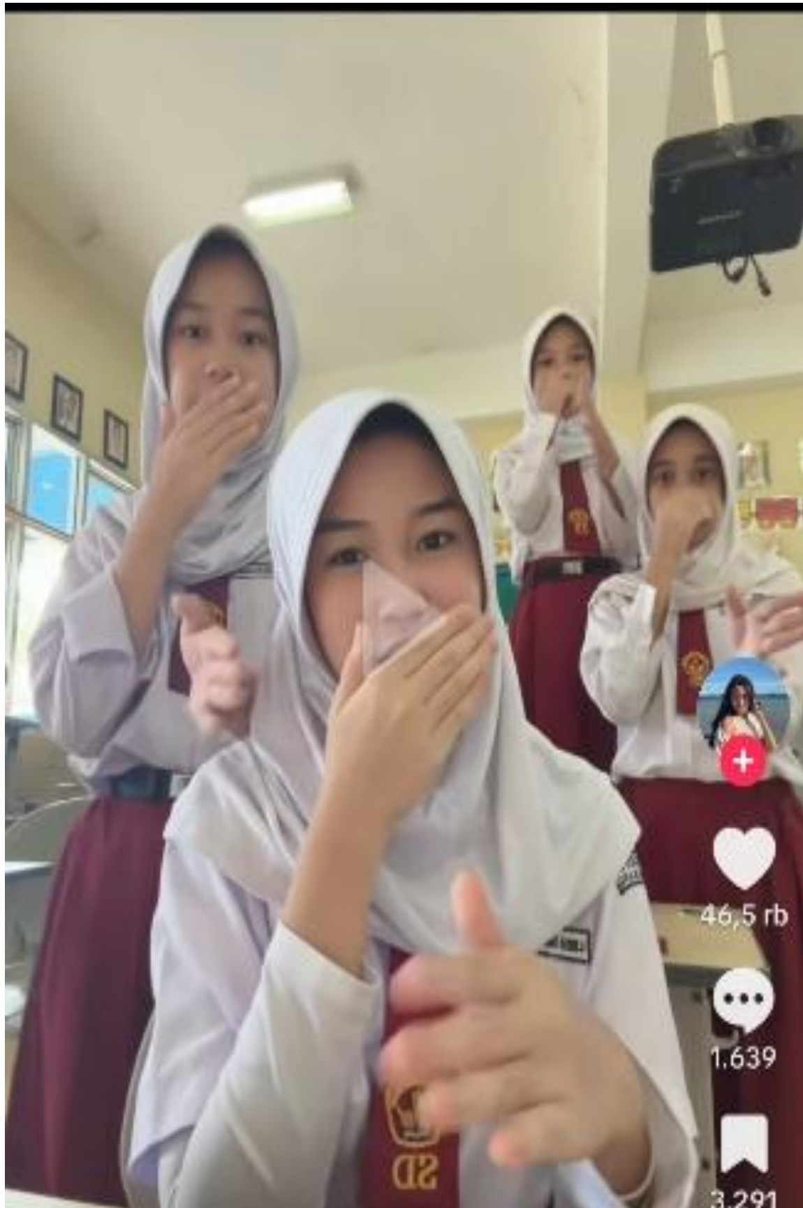
Gambar 2. Konten Viral Kicau Mania