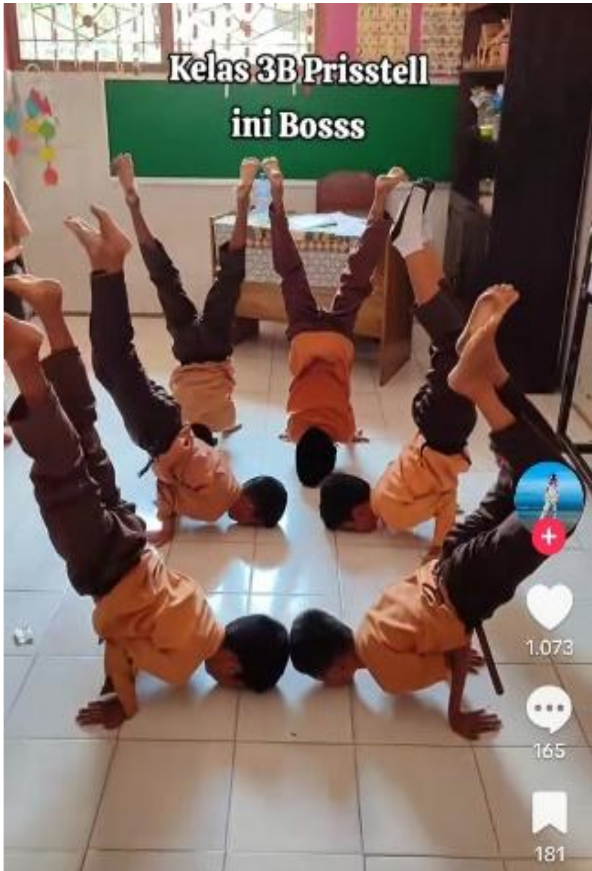
Gambar 1. Konten Viral Siswa Freestyle