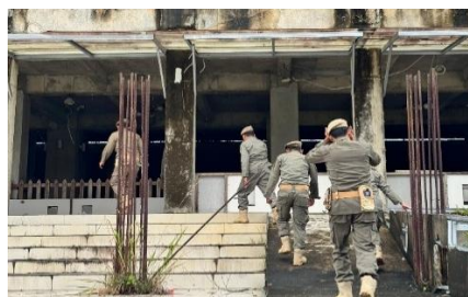
Gambar 2. Kegiatan Patroli Rutin Oleh Satpol PP Terhadap Bangunan.

Dalam perspektif Donald Black, kuantitas hukum merujuk pada seberapa banyak atau seberapa sering hukum diterapkan dalam masyarakat. Dalam konteks ini, Satpol PP sebenarnya sudah rutin melakukan patroli dan razia, terutama pada waktu-waktu yang dianggap rawan. Namun, fakta bahwa kasus masih terus muncul setiap tahun menunjukkan bahwa intensitas penegakan hukum tersebut belum cukup untuk menjangkau seluruh titik terjadinya pelanggaran. Apalagi, dari hasil penelitian terlihat bahwa pelanggaran sering terjadi di lokasi-lokasi yang pengawasannya rendah, seperti taman kota dan bangunan kosong.