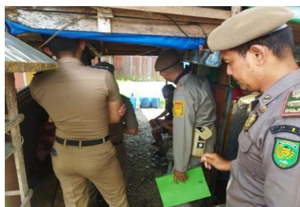
Gambar 3. Kegiatan Penertiban Remaja yang Menyalahgunakan Minuman Keras

Donald Black juga menjelaskan bahwa arah hukum menunjukkan kepada siapa hukum tersebut diterapkan atau diarahkan. Dalam hal ini, penegakan yang dilakukan selama ini lebih fokus kepada remaja sebagai pelaku langsung. Sementara itu, pihak yang menyediakan atau mendistribusikan minuman keras belum banyak tersentuh. Padahal, kemudahan akses terhadap minuman keras menjadi salah satu faktor utama yang mendorong terjadinya penyalahgunaan. Hal ini menjelaskan mengapa meskipun sudah dilakukan penertiban, kasus tetap berulang karena sumber masalahnya belum benar-benar ditangani.