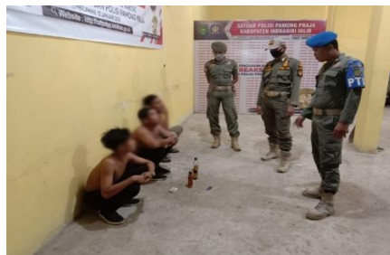
Gambar 3. Kegiatan Pembinaan pada Remaja yang menyalahgunakan minuman Keras

Menurut Donald Black, gaya hukum berkaitan dengan cara atau pendekatan yang digunakan dalam penegakan hukum, apakah bersifat persuasif atau represif. Dari sisi ini, pendekatan yang digunakan oleh Satpol PP lebih banyak bersifat persuasif, seperti memberikan nasihat, memanggil orang tua, dan membuat surat pernyataan. Pendekatan ini sebenarnya baik dari sisi pembinaan, tetapi dalam praktiknya belum memberikan efek jera yang kuat. Hal ini terlihat dari masih adanya pelaku yang mengulangi perbuatannya serta kecenderungan berpindah lokasi untuk menghindari razia.