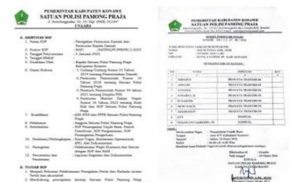
Gambar 5. SOP Pelaksanaan Operasi Gabungan dan Surat Tugas