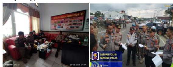
Gambar 3. Pelaksanaan Rapat Koordinasi dan Evaluasi oleh Satpol PP dan Polres Konawe

Dalam aspek pemahaman, sebagian besar personel telah memahami tugas dan fungsi masing-masing berdasarkan pedoman yang berlaku, seperti Peraturan Pemerintah Nomor 16 Tahun 2018 bagi Satpol PP dan Perkap Nomor 16 Tahun 2006 bagi Polri. Pemahaman ini diperoleh melalui pelatihan, pengalaman kerja sama, serta komunikasi intensif di lapangan.