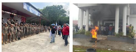
Gambar 4. Pelaksanaan Dalmas Awal oleh Satpol PP dan Dalmas Lanjutan oleh Polres Konawe

Pelaksanaan respon cepat ini terlihat dalam operasi gabungan yang ditunjukkan pada Gambar 4. Pelaksanaan Dalmas Awal oleh Satpol PP dan Dalmas Lanjutan oleh Polres Konawe. Pembagian peran dilakukan berdasarkan tingkat eskalasi situasi, sehingga penanganan dapat dilakukan secara bertahap dan proporsional.