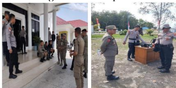
Gambar 2. Pelaksanaan Briefing Sebelum Kegiatan oleh Satpol PP dan Polres Konawe.

Komunikasi menjadi aspek penting dalam membangun sinergitas antar instansi. Hasil penelitian menunjukkan bahwa komunikasi antara Satpol PP dan Polres Konawe telah berjalan secara dua arah dan berjenjang. Sebelum pelaksanaan kegiatan, dilakukan briefing bersama untuk menyamakan persepsi terkait strategi dan pembagian tugas. Hal ini diperkuat dengan adanya dokumentasi pada Gambar 2. Pelaksanaan Briefing Sebelum Kegiatan oleh Satpol PP dan Polres Konawe.