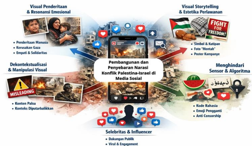
Gambar 2: Pembangunan dan penyebaran narasi konflik Palestina Israel di Media Sosial Aktor Media Sosial Isu Palestina-Israel