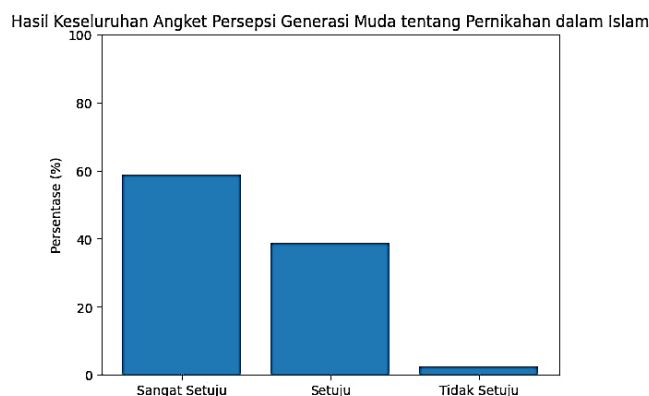
Gambar 1. Grafik Distribusi Jawaban Responden terhadap Konsep Pernikahan dalam Islam

Grafik berikut menunjukkan distribusi jawaban responden terhadap seluruh pernyataan dalam kuesioner.