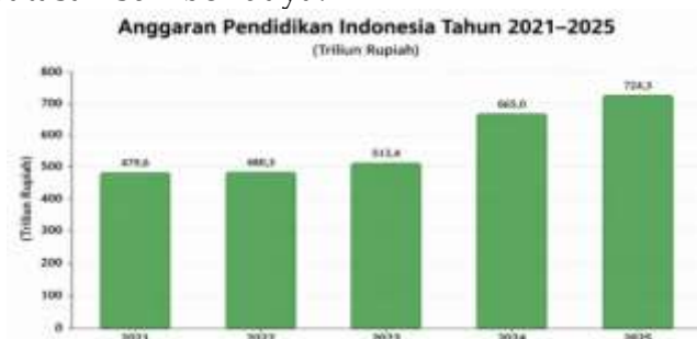
Gambar 2 Anggaran Pendidikan Indonesia Tahun 2021-2025